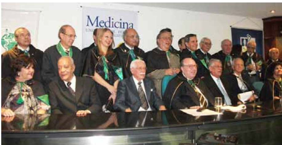
Acadêmicos e homenageados posam para foto oficial