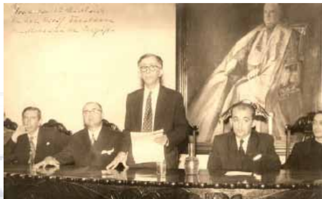
Instalação da Sociedade Civil Faculdade de Medicina em 1953 – Sonho não concretizado